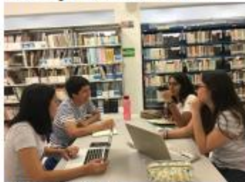
Mesa de trabajo