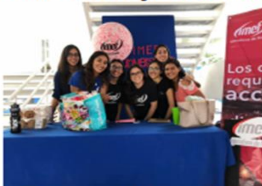
Día Experiencia IMEF