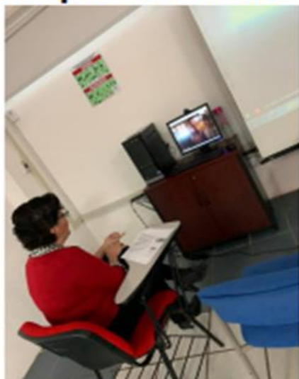
Modulo de emprendimiento: Fonde para emprendedores